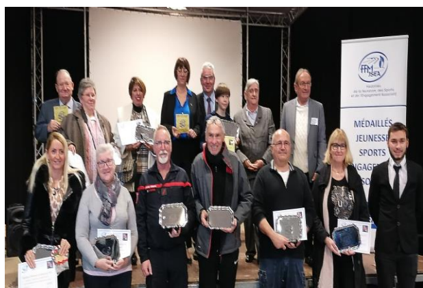
Les Récipiendaires et les Officiels

A la fin de cette cérémonie un pot de l'amitié a réuni tous les convives présents, pot offert par le CD34FFMJSEA et la Mairie de Poussan.