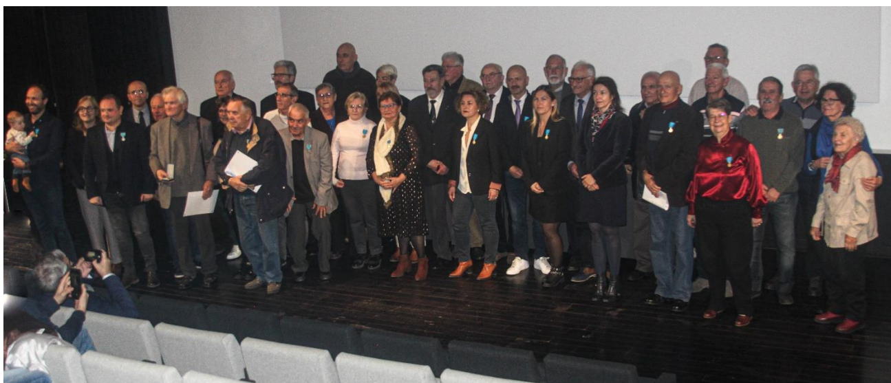
Les récipiendaires sur la scène de l'amphithéâtre de Pierres-Vives

Une manifestation prestigieuse qui a ravi les récipiendaires dans le cadre somptueux de ce sublime amphithéâtre de Pierres-Vives ! Pour clôturer cette manifestation un cocktail a été proposés aux participants, cocktail offert par le Comité Départemental de l'Hérault de la Fédération Française des Médaillés de la Jeunesse, du Sport et de l'Engagement Associatif .